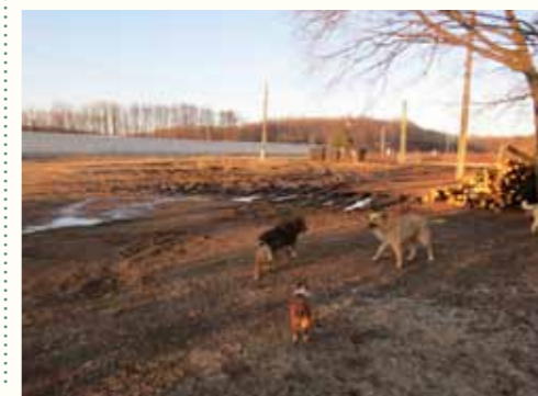
30) EDDA, weiblich, 9 Jahre alt, 50 cm groß, Crotal 26544, Auslauf 20/22

Emil wurde von seinen Besitzern während ihres Sommerurlaubs 2014 alleine hinter einem hohen Maschendrahtzaun zurückgelassen. Sie ließen Emil ohne Futter und Wasser zurück. Eine 92-jährige Nachbarin hörte Emil mehrere Tage bellen und jaulen und warf dem großen Rüden täglich Brot über den Zaun. Wasser konnte sie nicht über oder gar zwischen dem Zaun durchreichen und alarmierte mehrmals die Polizei. Es dauerte zwei Tage, bis sie endlich erschien. Die Polizei öffnete das verschlossene Tor und Emil bekam Futter und Wasser. Die Dame bat die Polizisten, nun täglich zu kommen, um ihr zu öffnen, doch die Polizisten verweigerten der alten Dame den Wunsch. Spontan lockte sie Emil schnell auf die Straße, öffnete die Türe des Polizeifahrzeuges und setzte sich hinein - Emil folgte und sprang über die Dame in den Wagen! Die Polizisten versuchten erbost, Emil aus dem Fahrzeug zu bekommen, hatten jedoch Angst, er könne beißen. Sie entschieden sich, zu uns in die Smeura zu fahren, um Emil wieder loszuwerden. So kam Emil in Begleitung seiner 92-jährigen Retterin und zweier Polizisten in die Smeura. Emil zeigt sich freundlich und aufgeschlossen, mit anderen Hunden ist er bedingt verträglich.