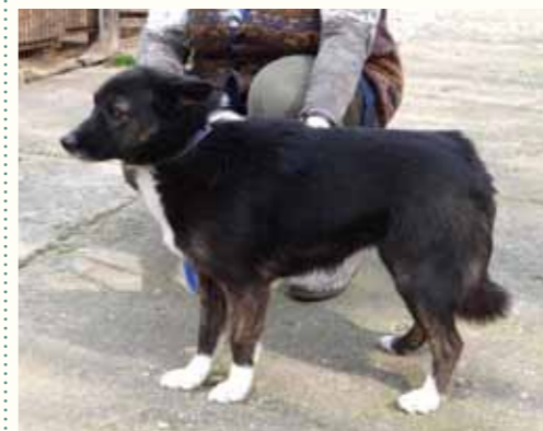
8) BETINA, weiblich, 5 Jahre alt, 40 cm groß, Crotal 25467, Auslauf 26/28