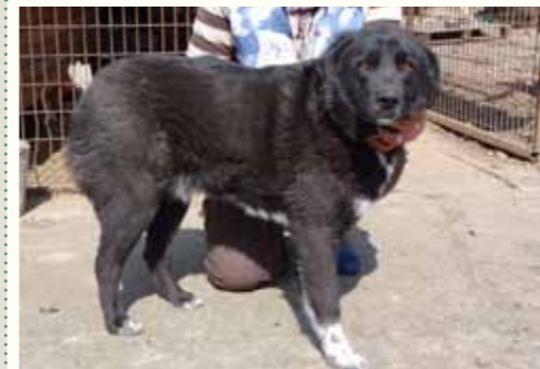
74) MACIAN , männlich, 5 Jahre alt, 60 cm groß, Crotal 18080, Auslauf 21/20

Landra wurde im Jahre 2010 durch uns kastriert und abgesichert durch eine Futterstelle wieder freigelassen. Nun wurde die Hündin Opfer der städtischen Hundefänger und fristete ein trauriges Dasein in der Tötungsstation des ehemaligen Bürgermeisters Tudor Pendiuc bis zu ihrer Übernahme in die Smeura. Landra zeigt sich ausgesprochen verträglich anderen Hunden gegenüber, ist Menschen gegenüber anfangs etwas verhaltener.