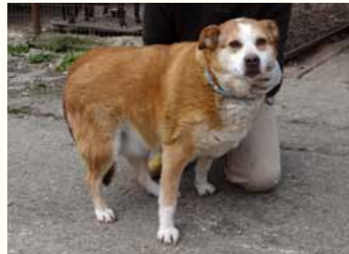
3) ADELIN, weiblich, 7 Jahre alt, 50 cm groß, Crotal 19633, Auslauf 21/23

Anemone wurde im Februar 2012 durch unser Team eingefangen und ist in der Smeura kastriert worden. Im Anschluss an die Kastration setzten wir Anemone, abgesichert durch eine Futterstelle, wieder zurück auf die Straßen Pitestis. Leider fiel auch sie im November 2013 den städtischen Hundefängern des Rathauses Pitestis zum Opfer und wurde in die städtische Tötungsstation gebracht. Nach der vorgeschriebenen 13-Tagesfrist konnten wir sie zu uns in die Smeura holen. Anemone zeigt sich ausgesprochen verträglich gegenüber anderen Hunden und ist eine menschenbezogene liebe Hündin.