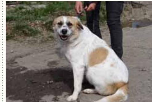
92) PHILIPA, weiblich, 4 Jahre alt, 50 cm groß, Crotal 24761, Auslauf 22/9

Odette wurde mit einer schlimmen infizierten offenen Wunde am Straßenrand eines Nachbardorfes gefunden. Die ältere Hündin litt sichtbar unter fürchterlichen Schmerzen und war zudem massiv unterversorgt. Aufgrund der Schwere ihrer Verletzung musste ihr hinteres rechtes Bein in unserer Smeura amputiert werden. Trotz ihres fortgeschrittenen Alters hat Odette die Operation gut überstanden und kommt mit ihrer Behinderung zurecht. Für Odette wünschen wir uns ein liebevolles Zuhause für ihren letzten Lebensabschnitt.