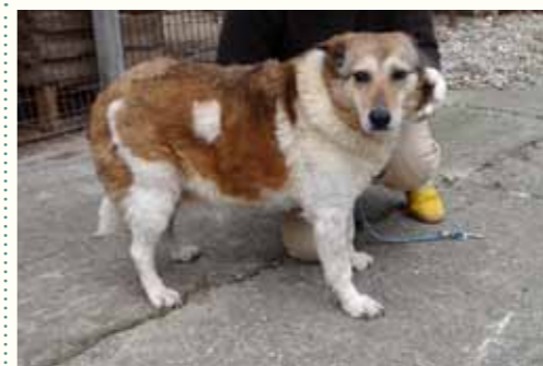
5) ALMA, weiblich, 12 Jahre alt, 55 cm groß, Crotal 19635, Auslauf 21/23

Beate wurde im Juni 2013 an der vierspurigen Hauptstraße Pitestis mit einer ausgefranzten Leine ausgesetzt. Passanten hatten den Vorfall beobachtet und alarmierten uns zum Glück über unsere Notfallnummer. Ein junger Mann konnte die Leine ergreifen und wartete am Parkplatz, bis unser Team eintraf. Beate zeigt sich anderen Hunden gegenüber sehr verträglich und ist Menschen gegenüber zugewandt und aufgeschlossen.