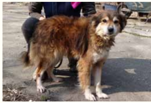
46) HOMER, männlich, 10 Jahre alt, 45 cm groß, Crotal A0274, Auslauf 22/31

Ilka wurde in der Stadt ausgesetzt. Ein Anwohner beobachtete, wie sie aus dem Auto geschubst wurde, die Tür sich schloss und das Auto weiterfuhr. Der Herr rief bei uns in der Smeura an, und wir holten die hilflos umherirrende Hündin sofort ab. Ilka zeigt sich Menschen gegenüber sehr freundlich und ist mit Artgenossen verträglich.