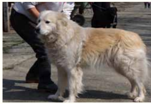
68) LANCE , männlich, 9 Jahre alt, 65 cm groß, Crotal 18268,, Auslauf 20/15

Krimhilde wurde am Bahnhof von Pitesti ausgesetzt aufgefunden. Ein Mitarbeiter der Bahn alarmierte uns und bat um rasche Übernahme aufgrund der hohen Gefahr des Schienenverkehrs. Wir eilten zum Bahnhof und nahmen Krimhilde zu uns. Krimhilde zeigt sich ausgesprochen freundlich und verträglich gegenüber anderen Hunden.