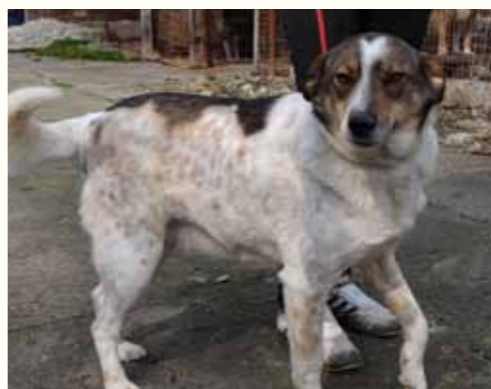
39) GORKI, männlich, 5 Jahre alt, 50 cm groß, Crotal 27422, Auslauf 27/26

Leider kommt das in dieser Form sehr häufig vor! Glücklicherweise konnten wir den städtischen Hundefängern zuvorkommen und brachten Georgia in unsere Smeura. Dort wurde sie gechipt, geimpft und kastriert. Georgia zeigt sich ausgesprochen freundlich und sehr verträglich gegenüber Menschen. sie ausgesprochen anhänglich, verspielt und ist mit anderen Hunden sehr verträglich.