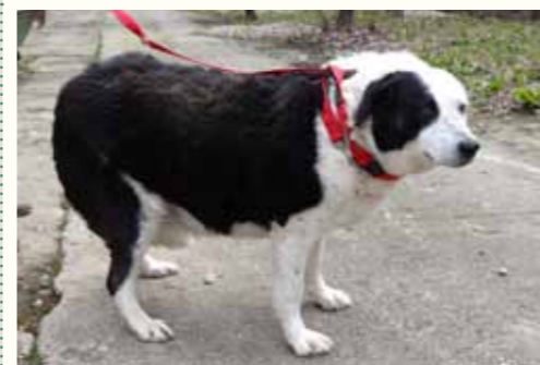
4) ANETTE, weiblich, 8 Jahre alt, 55 cm groß, Crotal A8676, Auslauf 20/23

Adeline wurde im November 2013 an einer stark befahrenen Hauptstraße Pitestis durch unser Team aufgegriffen. Völlig panisch und unkontrolliert rannte die Hündin an der Hauptstraße umher. Sicher stammt Adeline aus der dörflichen Gegend und wurde durch ihren ehemaligen Besitzer bewusst in der Stadt ausgesetzt, um sie den städtischen Hundefängern auszuliefern..... Glücklicherweise konnten wir ihnen zuvorkommen und Adeline zu uns in die Smeura nehmen. Nun ist Adeline gechipt, geimpft und kastriert und wartet sehnsüchtig auf ein liebevolles Zuhause.