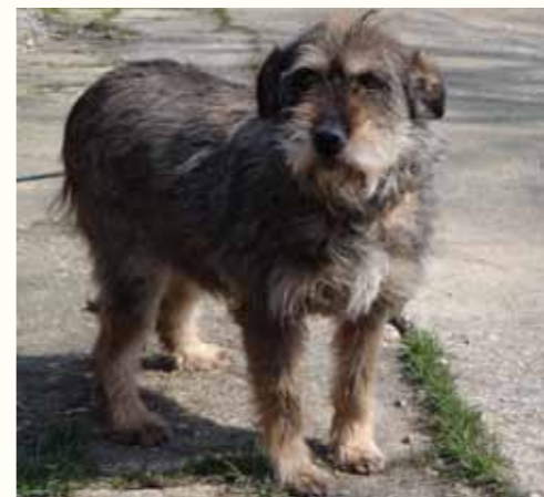
44) HOLLY, weiblich, 10 Jahre alt, 50 cm groß, Crotal 1291, Auslauf 20/19

Horia lebte bisher in der Stadt. Tagsüber hielt er sich sehr häufig auf einem Kinderspielplatz auf. Besorgte Eltern benachrichtigten uns und baten uns, den Rüden doch schnell abzuholen, bevor er den städtischen Hundefängern zum Opfer fiel. Es gelang- seit dem ist Horia in unserer Smeura und zeigt sich ausgesprochen freundlich und sehr menschenbezogen.