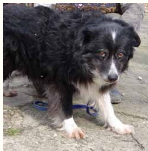
38) GEMMA, weiblich, 12 Jahre alt, 45 cm groß, Crotal 9311, Auslauf 26/18

Grace wurde durch die städtischen Hundefänger eingefangen und in die Tötungsstation des Bürgermeisters Tudor Pendiuc gebracht. Dort verweilte die Hündin traurige 13 Tage bis zu ihrer Übernahme in unsere Smeura. Grace zeigt sich verspielt, aufgeschlossen und mit anderen Hunden sehr verträglich.