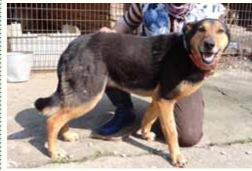
51) INKA, weiblich, 9 Jahre alt, 60 cm groß, Crotal 15097, Auslauf 21/21

Imre wurde von seinen Besitzern in der Smeura abgegeben. Die beiden Herren äußerten, den Hund sei nun im fortgeschrittenen Alter und sie wollten ihn nicht mehr behalten. Er sei im übrigen auch kein guter Wachhund. Imre ist ein sehr freundlicher Rüde, mit anderen Hunden zeigt er sich sehr verträglich.