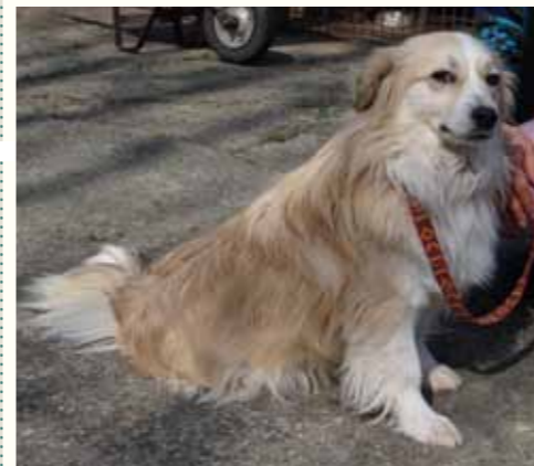
64) KAISER, männlich, 7 Jahre alt, 40 cm groß, Crotal 26650, Auslauf 17/14

Kailey lebte einige Jahre als kastrierte Hündin vor einem großen Hotel in Pitesti. Hier wurde sie über mehrere Jahre versorgt und gefüttert, nachts durfte sie häufig auch beim Personal der Rezeption schlafen und war im Winter vor Kälte und Witterung geschützt. Der ehemalige Bürgermeister Tudor Pendiuc schrieb eine Aufforderung an das Hotel, den Hund umgehend zu beseitigen, sonst würde er seiner Verpflichtung nachkommen und das Gesundheitsamt zu Kontrollen schicken. Die städtischen Hundefänger standen einen Tag später zur Abholung von Kailey bereits vor der Türe des Hotels. Der Hoteldirektor warf die dunklen Gestalten vor die Türe und versicherte ihnen, den kleinen Hund nicht mehr ins Hotel zu lassen. Schweren Herzens und voller Traurigkeit brachte er Kailey in unsere Smeura und bat uns, einen liebevollen Platz für die besonders freundliche und soziale Hündin zu suchen. Wir versprachen es dem mutigen Hoteldirektor.