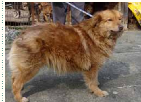
29) ELVIS, männlich, 7 Jahre alt, 60 cm, Crotal 15341, Auslauf 18/22

Enzo wurde durch seine ehemaligen Besitzer in eine städtische Tierarztpraxis für Großtiere zur jährlichen Impfung gebracht. Als der Arzt die Spritze aufzog und wieder ins Zimmer kam, war ausschließlich Enzo noch da - die Besitzer waren verschwunden! Am frühen Abend rief der junge Tierarzt in unserer Smeura an und bat um Abholung des stattlichen Schäferhundes, der sich ausgesprochen freundlich und aufgeschlossen zeigt. Enzo verträgt sich mit Hunden seiner Größe gut und ist in seiner Gruppe mit 7 weiteren Hunden verträglich.