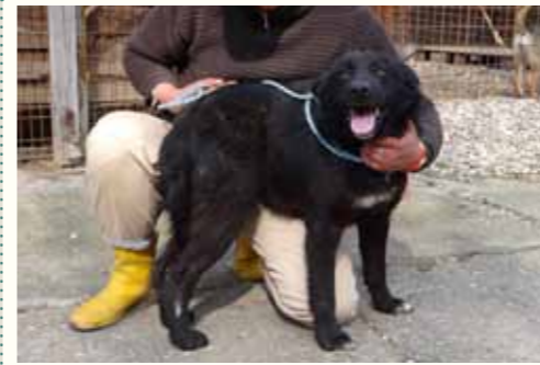
17) CHAPLIN, männlich, 4 Jahre alt, 50 cm, Crotal 28107, Auslauf 21/22

Sack durch Kunden des Supermarktes aufgefunden. Sie hörten den großen Rüden bellen und verständigten das Personal des Supermarktes. Dort waren auch unsere Flyer zu finden und die Herrschaften verständigten Ana-Maria. Clive ist ein sehr verspielter, freundlicher Hund, der sich mit anderen Hunden seiner Größe sehr verträglich zeigt.