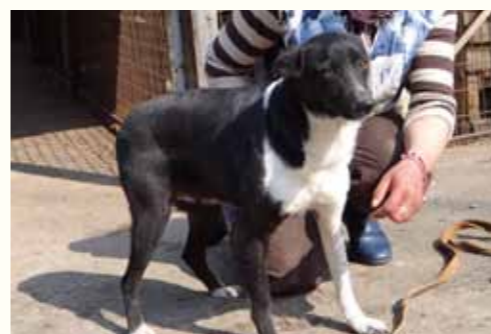
42) HAMLET, männlich, 4 Jahre alt, 50 cm groß, Crotal 24193, Auslauf 17/21

Gemma wurde im Jahre 2008 durch uns kastriert und als freilebende Hündin wieder zurück auf die Straße gesetzt. Aufgrund der Gesetzeslage konnte Gemma trotz Absicherung durch eine eingerichtete Futterstelle nicht mehr auf der Straße leben. Glücklicherweise konnten wir den städtischen Hundefängern zuvorkommen und nahmen Gemma zu uns in unsere Smeura. Gemma zeigt sich fremden Menschen gegenüber eher verhaltener, taut jedoch nach kurzer Eingewöhnungsphase auf. Nun wünschen wir uns für die ältere Hündin ein liebevolles Zuhause.