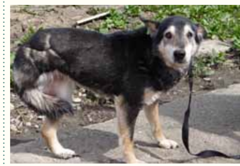
89) ODETTE, weiblich, 13 Jahre alt, 55 cm groß, Crotal 16516, Auslauf 25/5

Odette wurde mit einer schlimmen infizierten offenen Wunde am Straßenrand eines Nachbardorfes gefunden. Die ältere Hündin litt sichtbar unter fürchterlichen Schmerzen und war zudem massiv unterversorgt. Aufgrund der Schwere ihrer Verletzung musste ihr hinteres rechtes Bein in unserer Smeura amputiert werden. Trotz ihres fortgeschrittenen Alters hat Odette die Operation gut überstanden und kommt mit ihrer Behinderung zurecht. Für Odette wünschen wir uns ein liebevolles Zuhause für ihren letzten Lebensabschnitt.