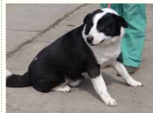
91) OTHO, männlich, 5 Jahre alt, 50 cm groß, Crotal 18476, Auslauf 3/6

Olis wurde zum Kastrieren in unsere Smeura gebracht und - wie sehr häufig- nicht mehr abgeholt. Auf unsere Anrufe reagierte niemand! Olis ist ein sehr sozialer Hund, der an anderen Hunden wenig Interesse zeigt. Der Rüde zeigt sich freundlich und aufgeschlossen und ist mit anderen Hunden verträglich.