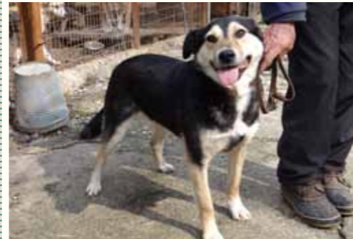
7) BEATE, weiblich, 4 Jahre alt, 55 cm groß,, Crotal 17924, Auslauf 25/32