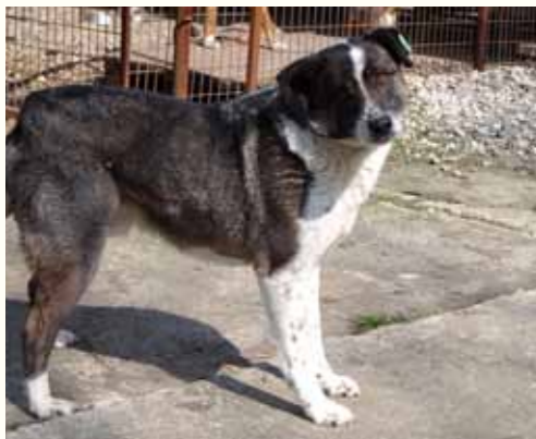
80) MEREK, männlich, 8 Jahre alt, 60 cm groß, Crotal 23128, Auslauf 20/12

Merek wurde zur Kastration in unserer Smeura abgegeben und - wie sehr häufig- nicht mehr abgeholt. Der ältere Rüde zeigt sich ausgesprochen freundlich und kontaktsuchend, mit anderen Hunden zeigt er sich verträglich und eher desinteressiert.