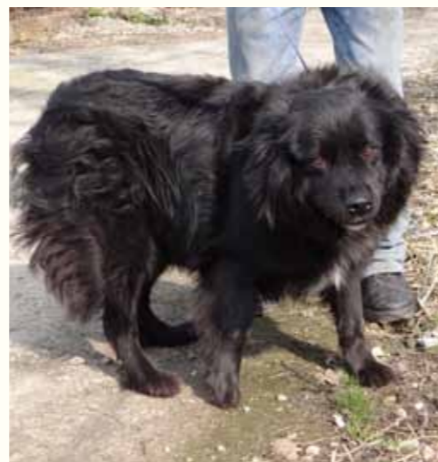
36) GRACE, weiblich, 4 Jahre alt, 50 cm groß, Crotal 25280, Auslauf 22/33

Fax wurde von seinen Besitzern in unserer Smeura abgegeben, da er angeblich die Hühner im Hof jagen würde. Bei seiner Abgabe war er äußerst verwahrlost und unterernährt. Nach einem kurzen Aufenthalt in unserer Krankenstation konnte Fax sich schnell erholen. Der Rüde zeigt sich freundlich und aufgeschlossen, mit anderen Hunden ist er verträglich.