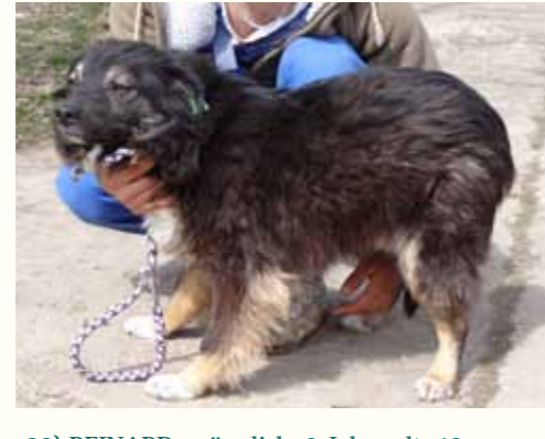
99) REINARD, männlich, 2 Jahre alt, 40 cm groß, Crotal 26168, Auslauf 3/1

Rene wurde zum Kastrieren in unsere Smeura gebracht und leider - wie sehr häufig - nicht mehr abgeholt. Rene ist ein sehr sozialer Hund, der an anderen Hunden wenig Interesse zeigt. Die unruhige Situation in unserer Smeura ist sehr belastend für den sensiblen Hund. Für Rene wünschen wir uns ein liebevolles Zuhause.