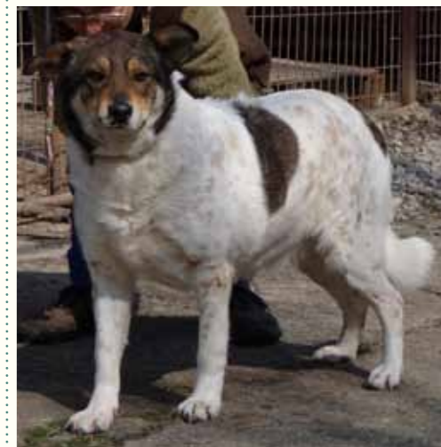
63) KARLA, weiblich, 6 Jahre alt, 55 cm groß, Crotal 18375, Auslauf 18/8

Kasch ist ein freundlicher Rüde und zeigt sich bei uns verträglich mit seinen Artgenossen.