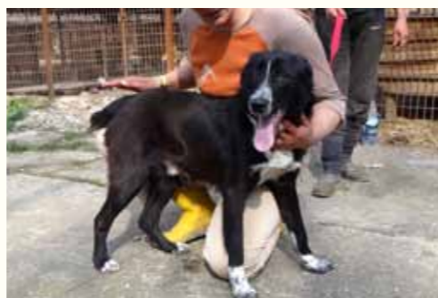
33) FAX, männlich, 3 Jahre alt, 55 cm groß, Crotal 28135, Auslauf 20/21

Gina wurde im Oktober 2014 durch uns auf Wunsch ihrer Besitzer kastriert. Ihre Besitzerin holte Gina im Anschluss an die Kastration ab und nahm sie zu wieder zu sich nach Hause. Die Dame äußerte, wie gut sie die Arbeit der Smeura findet und wie hilfreich die kostenlose Kastration sei. Schrecklicherweise verunfallte die liebe Dame nun im Januar 2015 und Angehörige brachten Gina zu uns in die Smeura, um ihr die Möglichkeit auf ein neues Zuhause zu geben... Gina zeigt sich verträglich, ist eher desinteressiert an anderen Hunden und ist menschenbezogen.