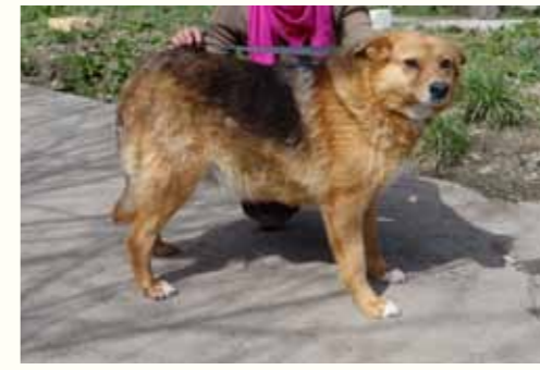
102) RAIMONDE, weiblich, 11 Jahre alt, 60 cm groß, Crotal A7085, Auslauf 22/1

Rittel wurde aufgrund seines Alters in unserer Smeura abgegeben. Der unfreundliche Besitzer äußerte, der Hund sei zu nichts mehr zu gebrauchen, er schlafe zu viel und würde den Hof und auch den Garten nicht mehr anständig bewachen. Rittel ist ein ruhiger, freundlicher Rüde auf der Suche nach einem guten Zuhause. Mit anderen Hunden zeigt sich Rittel verträglich. Nun suchen wir ein liebevolles Zuhause für den freundlichen und verträglichen Rüden.