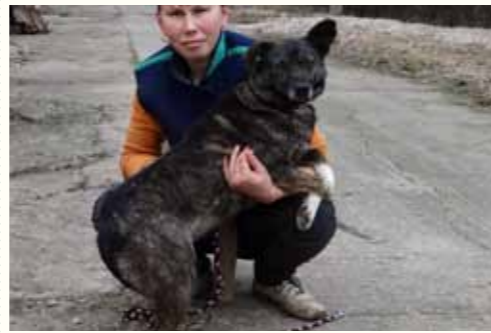
12) BINE, weiblich, 7 Jahre alt, 40 cm groß,

Clive wurde neben einem Müllcontainer eines großen Supermarktes in einem zugeschnürten