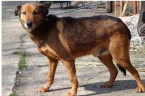
50) IMRE, männlich, 8 Jahre alt, 55 cm groß, Crotal 17544, Auslauf 20/18

Hadria wurde von einem jungen Paar, das Nachwuchs erwartete, in unserer Smeura abgegeben. Sie äußerten, sie hätten Angst um ihr Kind und könnten Hadria nicht mehr länger behalten. Hadria ist eine ganz besonders menschenbezogene Hündin, die rasch Vertrauen zu ihrer Tierpflegerin gefasst hat, und verträglich ist mit anderen Hunden.