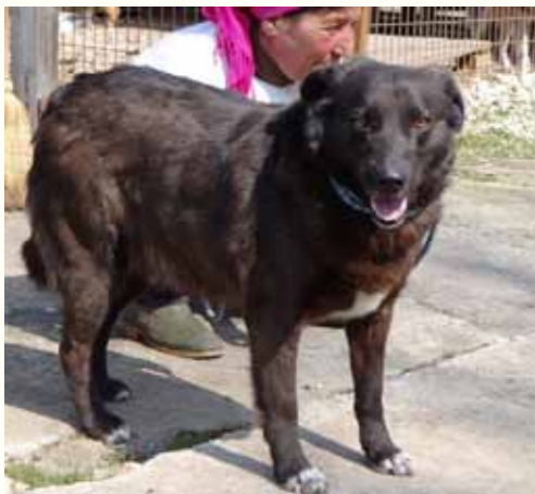
73) LEWIE , männlich, 5 Jahre alt, 55 cm, Crotal 22495, Auslauf 20/10

Mayne wurde von einem sehr alten Mann unter Tränen in unserer Smeura abgegeben. Er habe Haus und Hof verkaufen müssen und lebe nun in einer sehr kleinen Stadtwohnung und könne Mayne nicht mehr behalten, da die Stadtverwaltung keine Hunde in den Wohnungen duldet. Mayne zeigt sich ganz besonders menschenbezogen und ausgesprochen freundlich, mit Artgenossen zeigt er sich verträglich.