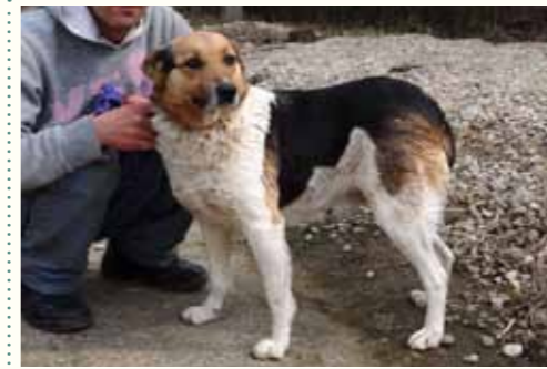
18) CARMELA, weiblich, 13 Jahre alt, 50 cm, Crotal 27433, Auslauf 23/27

Carmela wurde gemeinsam mit ihren vier Welpen vor der Smeura ausgesetzt. Die Welpen waren sehr geschwächt, überlebten aber dank schneller medizinischer Versorgung und Futter.