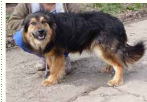
88) OLIS, männlich, 6 Jahre alt, 55 cm groß, Crotal 26161, Auslauf 3/1

Wir nahmen Otilie auf und verabschiedeten den Mann zügig. Ihr vorderes rechtes Bein musste amputiert werden. Seit der Amputation ist Otilie deutlich weniger beeinträchtigt und kommt gut damit zurecht. Otilie zeigt sich verträglich und freundlich.