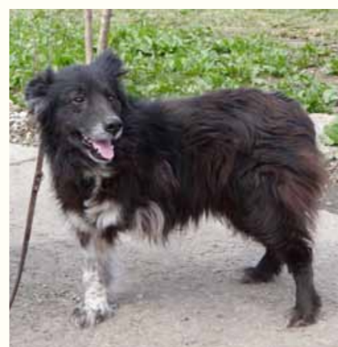
90) OTILIE, weiblich, 8 Jahre alt, 45 cm groß, Crotal 15145, Auslauf 25/1

Obert wurde durch einen Verkehrsunfall schwer verletzt aufgefunden. Eine tierliebende Dame, die den Unfall beobachtet hatte, verständigte uns. Leider konnte sein hinteres rechtes Bein nicht erhalten bleiben und musste bei uns amputiert werden. Obert hat sich trotz seines Alters gut erholt und ist nun auf der Suche nach einem liebevollen Zuhause für seinen letzten Lebensabschnitt.