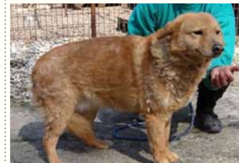
76) MADDALEN , weiblich, 6 Jahre alt, 50 cm groß, Crotal 22451, Auslauf 19/13

Macon wurde von seinem ehemaligen Besitzer in die städtische Tötungsstation zur Tötung gegeben. Ein Mitarbeiter unserer Smeura - es war an einem Tag, an dem wir Hunde aus der Tötung übernahmen - machte den Herrn noch darauf aufmerksam, dass dies hier die städtische Tötung sei und die Smeura 200 Meter weiter unten liege und der Hund dort nicht getötet werde. Doch der verbitterte Mann wollte Macon verbindlich und entschlossen in die städtische Tötung geben. Unser Mitarbeiter erklärte erneut, wie brutal die städtischen Hundefänger mit den Hunden umgehen und dass wir den Hund ohnehin nach 14 Tagen übernehmen werden, aber der Mann blieb eiskalt, bis unser Mitarbeiter ihm den Hund an der Leine entriss und Macon mit in unsere Smeura nahm... Macon zeigt sich aufgeschlossen und sehr verträglich mit Artgenossen.