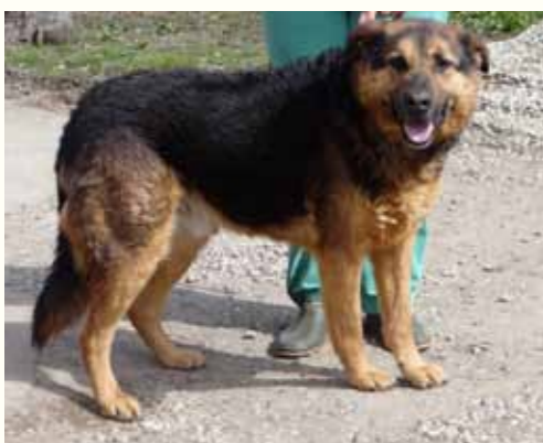
6) NOBEL, männlich, 10 Jahre alt, 60 cm Crotal 19542, Auslauf 3/8

Nicklaus wurde zum Kastrieren in unsere Smeura gebracht und - wie sehr häufig- nicht mehr abgeholt. Auf unsere Anrufe reagierte der Mann nicht! Nicklaus ist ein sehr sozialer Hund, der an anderen Hunden wenig Interesse zeigt. Die unruhige Situation in unserer Smeura ist sehr belastend für den Rüden. Nicklaus ist sehr freundlich und aufgeschlossen, gegenüber anderen Hunden zeigt er sich etwas verhaltener, teils sogar ängstlich.