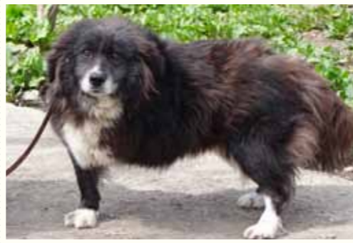
97) RANDOLF, männlich, 7 Jahre alt, 40 cm groß, Crotal 17337, Auslauf 25/13

Raibert wurde von den städtischen Hundefängern gejagt und letztendlich mit einem Betäubungsgewehr geschossen. Als er erwachte, befand er sich bereits in der städtischen Tötungsstation des ehemaligen Bürgermeisters Tudor Pendiuc. Dort fristete der Rüde ein trauriges Dasein bis zu seiner Übernahme in die Smeura. Raibert ist verträglich gegenüber anderen Hunden, bei Menschen zeigt er sich anfangs eher verhalten und benötigt eine gewisse Zeit, bis er Vertrauen fasst.