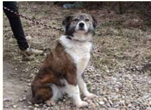
2) ANEMONE, weiblich, 5 Jahre alt, 40 cm groß, Crotal A7865, Auslauf 22/24

Axel ist seit Januar 2012 in unserer Smeura. Er wurde seinerzeit verunfallt und in miserablem Zustand von unserem Notfallteam auf den Nebenstraßen Pitestis mit einer fünfmarkstückgroßen Wunde am Kopf aufgefunden. Axel wurde mehrere Wochen antibiotisch gegen die starke Infektion seiner Kopfwunde behandelt. Mittlerweile hat sich Axel erholen können und ist ein von einem entbehrensreichen Leben gezeichneter Hund, der sich ausgesprochen verträglich mit Artgenossen und anderen Hunden zeigt.