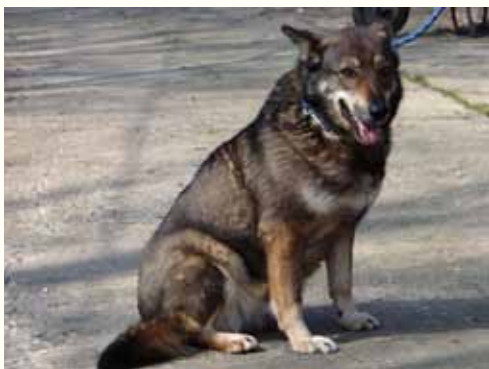
48) ILKA, weiblich, 6 Jahre alt, 50 cm groß, Crotal 22416, Auslauf 19/17