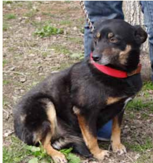
100) RICHENDA, weiblich, 3 Jahre alt, 35 cm groß, Crotal 26112, Auslauf 23/24

Reinard wurde von seinem ehemaligen Besitzer regelmäßig verprügelt! Eine Nachbarin konnte das Elend nicht mehr ertragen und verständigte uns. Der ungehaltene Mann erlaubte uns nicht, das Grundstück zu betreten und verständigte die Polizei. Als diese ankam, fasste sich die tierliebe Nachbarin Mut und machte eine verbindliche Aussage - die Polizei beschlagnahmte Reinard und übergab den jungen Rüden an uns. Der ungehaltene Mann äußerte sich auch der Polizei gegenüber höchst respektlos und drohte allen Schläge an - daraufhin verbrachte er eine Nacht auf der Wache! Reinard ist trotz seiner Misshandlungen, denen er ausgesetzt war, ein sehr menschenbezogener Hund und freundlich zu Artgenossen.