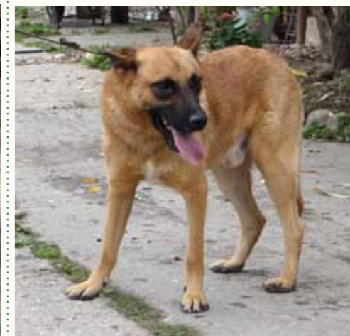
79) MAYNE , männlich, 5 Jahre, 60 cm, Crotal 24608, Auslauf 21/18

Manfred wurde vor fünf Jahren durch uns kastriert und abgesichert durch eine Futterstelle wieder zurück auf die Straße gesetzt. Nun fiel der ältere Rüde den städtischen Hundefängern zum Opfer und fristete ein trauriges Dasein in der städtischen Tötungsstation bis zu seiner Übernahme in unsere Smeura. Manfred zeigt sich anderen Hunden gegenüber eher desinteressiert und ist freundlich und aufgeschlossen zu uns Menschen.