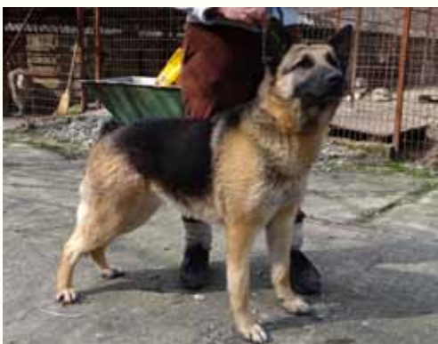
34) FIONA, weiblich, 6 Jahre alt, 65 cm groß Crotal 23464, Auslauf 19/18

Fifi wurde gemeinsam mit ihren 5 Welpen auf einem Maisfeld entdeckt. Vermutlich hatte sie dort für sich und ihre Welpen Schutz gesucht. Nicht ungefährlich, denn die Zeit der Ernte stand kurz bevor. Glücklicherweise entdeckten Feldarbeiter die Hündin, bevor ein Unglück geschehen konnte und benachrichtigten uns. Mittlerweile sind Fifis Welpen in Deutschland und für Fifi wünschen wir uns ebenfalls ein liebevolles Zuhause.