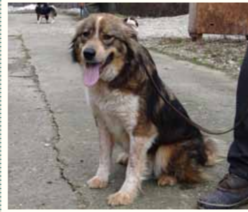
20) DENISE, weiblich, 6 Jahre alt, 55 cm groß, Crotal 25301, Auslauf 25/30

Chaplin wurde von seinen Besitzern in verwahrlostem Zustand in unserer Smeura abgegeben. Sie äußerten, der Hund könne weder jagen noch das Grundstück bewachen, sie brauchen ihn nicht mehr... Chaplin zeigt sich ausgesprochen lieb und menschenbezogen, mit anderen Hunden ist er verträglich und verspielt.