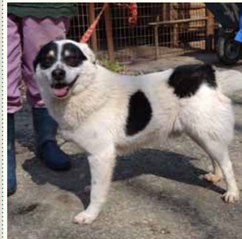
77) MARTELL , männlich, 6 Jahre alt, 50 cm, Crotal 22478, Auslauf 17/24

Lennard wurde auf der Hauptstraße in Pitesti gefunden. Eine Polizeistreife entdeckte den winselnden und taumelnden Hund auf der Straße. Sie verständigten uns sofort über die Notfallnummer. Unser Tierarzt als auch der diensthabende Mitarbeiter machten sich sofort auf den Weg und konnten ihm noch vor Ort eine Infusion anlegen, da sie eine Vergiftung befürchteten. Die Untersuchung in unserer Tierarztpraxis bestätigte den Verdacht! Zu seinem Glück hatte er wohl nur eine geringe Menge des Giftes aufgenommen und auch dank der beherzten Hilfe der Polizeistreife geht es ihm heute wieder gut. Lennard zeigt sich ausgesprochen freundlich Menschen gegenüber und ist verträglich mit Artgenossen.