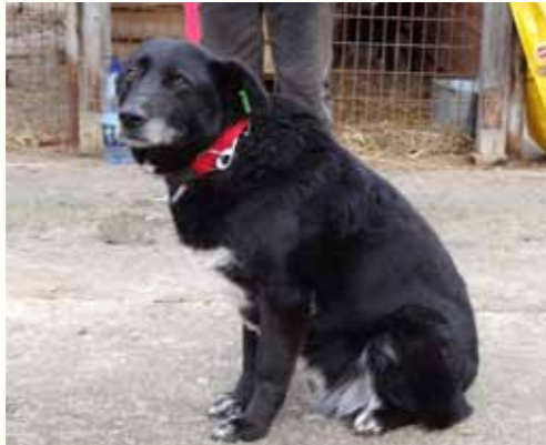
14) CASPER, männlich, 10 Jahre alt, 50 cm groß, Crotal 23911, Auslauf 20/23

Benjamin wurde von seinem ehemaligen Besitzer im Wald vor unserer Smeura an einen Baum gebunden. Unser Nachtwächter bemerkte es durch das Bellen der Hofhunde und machte sich auf den Weg. Er fand einen völlig verunsicherten und panischen Hund vor. Es dauerte mehrere Wochen, bis Benjamin wieder Vertrauen zu Menschen fassen konnte. Der Rüde zeigt sich verträglich mit anderen Hunden und reagiert auf Menschen freundlich, jedoch etwas verhaltener.