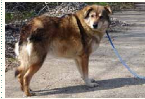
53) ICAR, männlich, 9 Jahre alt, 50 cm groß, Crotal 27603, Auslauf 19/19

Jana wurde von einer sehr arroganten Dame in unserer Smeura abgegeben. Die Frau äußerte hartherzig, sie würde sich nun einen „neuen“ Hund im Welpenalter zulegen und habe deshalb keinen Platz und keine „Verwendung“ mehr für die ausgewachsene Hündin... Selbstverständlich konnte Jana bei uns bleiben. Jana ist eine sehr freundliche und verträgliche Hündin.