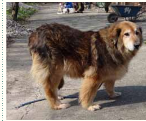
62) KALONA, weiblich, 12 Jahre alt, 65 cm, Crotal 4253, Auslauf 19/16

Kaiser wurde auf dem Gemüsemarkt von Pitesti gefunden. Eine Bäuerin verständigte uns und bat um schnelle Hilfe, bevor die städtischen Hundefänger kommen würden. Glücklicherweise kamen wir diesen zuvor und nahmen den hübschen Rüden zu uns. Kaiser zeigt sich sehr freundlich und aufgeschlossen, mit anderen Hunden ist er verträglich.