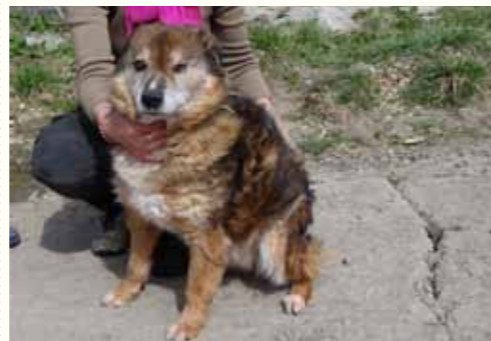
82) NEF, männlich, 15 Jahre alt, 45 cm groß, Crotal 4477, Auslauf 22/10

Nobel wurde von seinem ehemaligen Besitzer in unserer Tierarztpraxis abgegeben. Der Rüde hatte eine massive Blasenentzündung und musste über einen längeren Zeitraum antibiotisch behandelt werden. Glücklicherweise konnte sich der ältere Rüde erholen, jedoch wollte sein Besitzer den Rüden nicht mehr zu sich zurück holen. Nobel wirkt traurig und benötigt dringend einen liebevollen Platz für seinen letzten Lebensabschnitt.