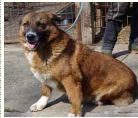
61) KAILEY, weiblich, 11 Jahre alt, 40 cm, Crotal A8297, Auslauf 20/16

Jarvis wurde von einem Versicherungsvertreter in unserer Smeura abgegeben. Der Mann fand den großen Rüden auf der Hauptstraße von Pitesti, und da auch er mitbekommen hatte, wie brutal und bestialisch die Hunde von den städtischen Hundefängern eingefangen werden, fasste er sich ein Herz und packte Jarvis auf die Rückbank seiner Limousine und fuhr zu uns in die Smeura... Jarvis ist ein aufgeschlossener und verträglicher Rüde auf der Suche nach einem liebevollen Zuhause.