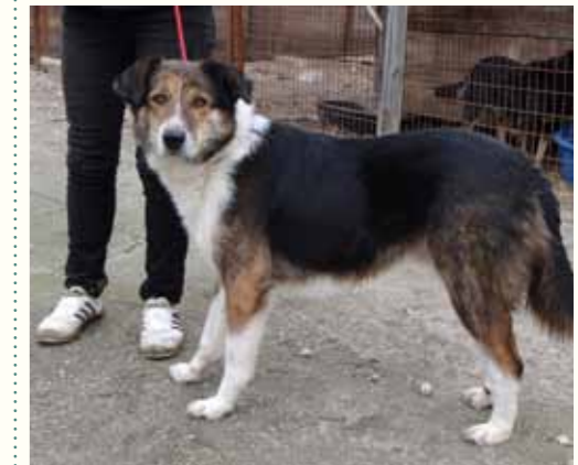
22) DUKE, männlich, 5 Jahre alt, 55 cm groß, Crotal 27409, Auslauf 27/35

Danielle wurde an einer kurzen Kette im Hinterhof eines Bauernhauses gehalten. Als Nachbarn beobachteten, dass Danielle über Tage kein Futter und Wasser mehr bekam, verständigten sie uns. Als unser Notfallteam ankam, gab der Bauer an, er habe kein Geld mehr für die Hündin und wollte sie verhungern lassen. Nun könnten wir sie ja mitnehmen, wenn es uns nicht passen würde, gab er unverschämmt zur Antwort. Danielle ist eine ruhige, freundliche und aufgeschlossene Hündin und mit anderen Hunden verträglich.