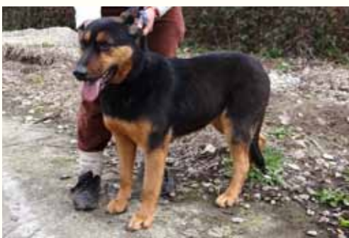
31) FIFI, weiblich, 9 Jahre alt, 60 cm groß, Crotal 24494, Auslauf 19/21

Fifi wurde gemeinsam mit ihren 5 Welpen auf einem Maisfeld entdeckt. Vermutlich hatte sie dort für sich und ihre Welpen Schutz gesucht. Nicht ungefährlich, denn die Zeit der Ernte stand kurz bevor. Glücklicherweise entdeckten Feldarbeiter die Hündin, bevor ein Unglück geschehen konnte und benachrichtigten uns. Mittlerweile sind Fifis Welpen in Deutschland und für Fifi wünschen wir uns ebenfalls ein liebevolles Zuhause.