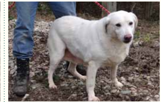
19) DANIELLE, weiblich, 11 Jahre alt, 50 cm, Crotal 24950, Auslauf 24/31

Donovan ist seit nunmehr 5 Jahren in unserer Smeura. Der ältere Rüde benötigt dringendst für seinen letzten Lebensabschnitt ein liebevolles Zuhause. Leider hatte der freundliche Rüde bislang keinerlei Chancen, ausreisen zu dürfen. Mit anderen Hunden in seiner Auslaufgruppe zeigt er sich sehr verträglich.