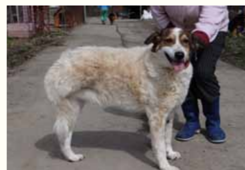
87) OBERT, männlich, 14 Jahre alt, 60 cm Crotal 24317, Auslauf 32/22

Eduard ist einer der ersten Hunde, der in unserer Smeura kastriert und wieder freigelassen wurde. Nun fiel er den städtischen Hundefängern zum Opfer und der 15-jährige Hund fristete ein trauriges Dasein in der städtischen Tötungsstation bis zur Übernahme in unsere Smeura. Eduard zeigt sich freundlich und verträglich, für den alten Rüden wünschen wir uns dringendst ein liebevolles Zuhause für seinen letzten Lebensabschnitt.