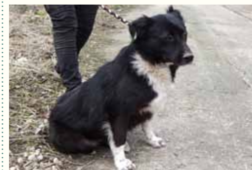
6) ARETHA, weiblich, 10 Jahre alt, 55 cm groß, Crotal 27636, Auslauf 22/23

Betina wurde im Wald vor unserer Smeura ausgesetzt. Unsere Mitarbeiter konnten sie am frühen Morgen auf dem Weg in die Smeura aufgreifen und nahmen sie mit zu uns. Betina zeigt sich verspielt, ist anderen Hunden gegenüber verträglich und sehr menschenbezogen. Betina benötigt dringend ein liebevolles Zuhause, da sie Kontakt zu Menschen sucht.