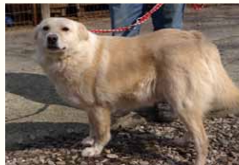
24) DUSTER, männlich, 6 Jahre alt, 55 cm, Crotal 25216, Auslauf 24/29

Duster wurde zwischen Weihnachten und Neujahr von einer älteren Dame über mehrere Tage auf dem Friedhof Pitestis gesehen. Weil es zu dieser Zeit eisig kalt und der Rüde der Kälte schutzlos ausgeliefert war, rief die Dame bei uns an. Unsere Mitarbeiter nahmen Duster zu uns in die Smeura und versorgten ihn. Mittlerweile ist Duster gechipt, geimpft und kastriert und auf der Suche nach einem liebevollen Zuhause.