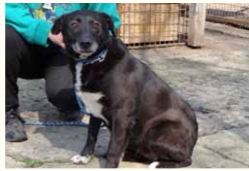
69) LANDRA , weiblich, 7 Jahre alt, 50 cm, Crotal 27602, Auslauf 19/16

Lance wurde zum Kastrieren in unsere Smeura gebracht und leider - wie sehr häufig- nicht mehr abgeholt. Niemand erkundigte sich nach Lance und unsere Anrufe blieben unbeantwortet. Für Lance wünschen wir uns ein liebevolles Zuhause für seinen letzten Lebensabschnitt.