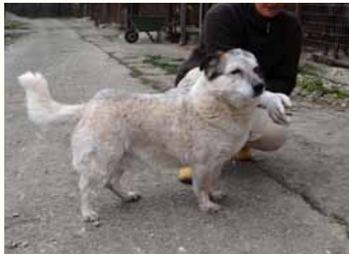
1) AXEL, männlich, 6 Jahre alt, 40 cm groß, Crotal A7635, Auslauf 21/24

Axel ist seit Januar 2012 in unserer Smeura. Er wurde seinerzeit verunfallt und in miserablem Zustand von unserem Notfallteam auf den Nebenstraßen Pitestis mit einer fünfmarkstückgroßen Wunde am Kopf aufgefunden. Axel wurde mehrere Wochen antibiotisch gegen die starke Infektion seiner Kopfwunde behandelt. Mittlerweile hat sich Axel erholen können und ist ein von einem entbehrensreichen Leben gezeichneter Hund, der sich ausgesprochen verträglich mit Artgenossen und anderen Hunden zeigt.