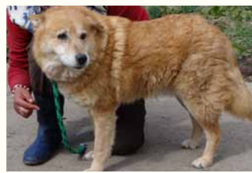
102) RITTEL, männlich, 9 Jahre alt, 55 cm groß, Crotal 24467, Auslauf 21/3

Randolf wurde verunfallt in Pitesti aufgefunden. Leider konnte sein vorderes rechtes Bein aufgrund der schweren Verletzung nicht erhalten bleiben und musste amputiert werden. Randolph kommt mit seiner Beeinträchtigung gut zurecht. Für den freundlichen Rüden wünschen wir uns ein liebevolles Zuhause bei Menschen, die ihm viel Zuneigung schenken.