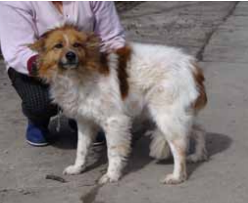
98) RENE, männlich, 5 Jahre alt, 45 cm groß, Crotal A6074, Auslauf 32/5

Raimonde wurde gemeinsam mit ihren 2 Welpen im Wald vor unserer Smeura ausgesetzt aufgefunden. Die ehemaligen Besitzer hatten die Welpen in einen Karton gepackt und diesen neben ihr im Wald auf dem Waldweg abgestellt. Raimonde blieb dicht beim Karton und bewachte ihre Welpen, als sich unser Nachtwächter ihr näherte. Raimonde's Welpen sind bereits in Deutschland. Nun sucht auch die freundliche und aufgeschlossene Hündin ein liebevolles Zuhause. An anderen Hunden zeigt sich Raimonde eher desinteressiert.