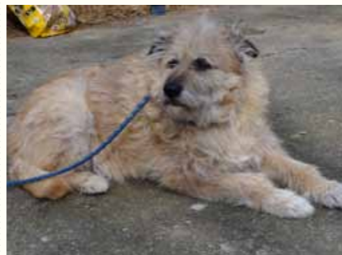
85) EDUARD, männlich, 15 Jahre alt, 60 cm groß, Crotal A7025, Auslauf 19/22

Nef ist seit vier Jahren in unserer Smeura. Als wir ihn derzeit aufgefunden hatten, litt er an einer heftigen Entzündung des rechten Auges. Leider hatte der ältere Rüde bisher keine Chance auf ein liebevolles Zuhause. Für den älteren - sehr freundlichen- Rüden wünschen wir uns für seinen letzten Lebensabschnitt ein ruhiges Zuhause, in dem er sich geborgen fühlt.