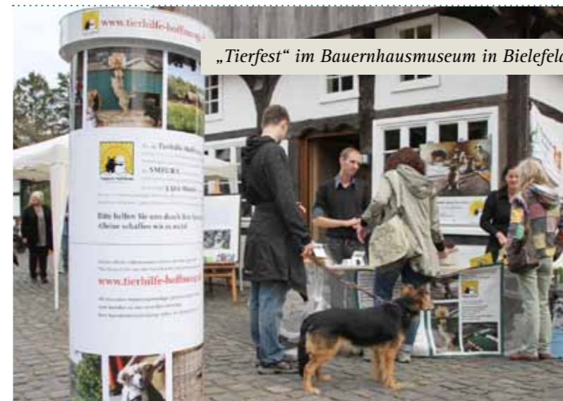
„Tierfest“ im Bauernhausmuseum in Bielefeld