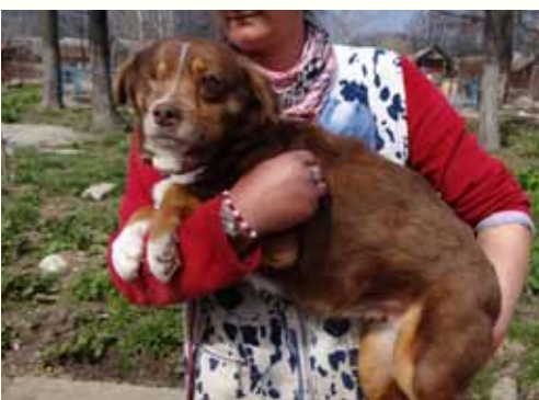
83) NETTE, weiblich, 9 Jahre alt, 45 cm groß, Crotal 2101, Auslauf 20/3

Minne lebte mehrere Jahre auf dem Hinterhof eines Restaurantes. Dort wurde der Rüde täglich mit allen möglichen fetthaltigen Lebensmittelresten gefüttert, bis sich die Nachbarn gestört fühlten und drohten, die städtischen Hundefänger zu benachrichtigen. Die Köchin des Restaurants verständigte uns und bat um rasche Übernahme, da er ansonsten mit Sicherheit den städtischen Hundefängern zum Opfer fallen würde. Minne benötigt dringend einen liebevollen Platz.