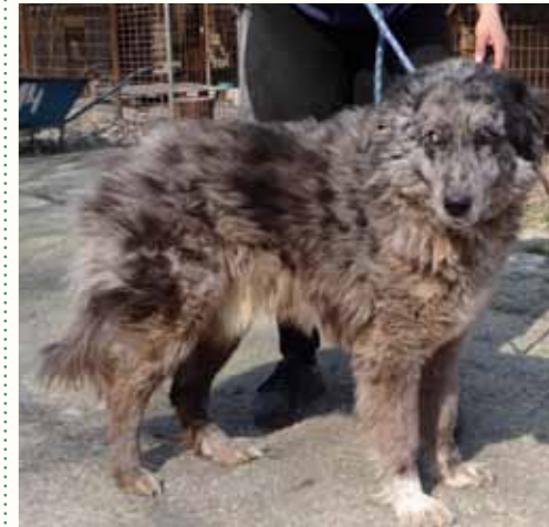
56) JACK, männlich, 9 Jahre alt, 65 cm groß, Crotal 24061, Auslauf 19/11