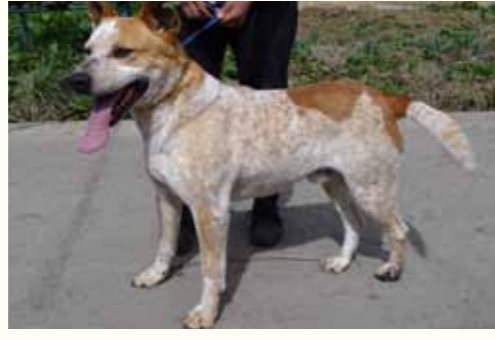
96) RAIBERT, männlich, 6 Jahre alt, 55 cm groß, Crotal 16526, Auslauf 19/4