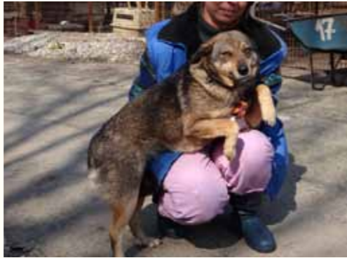
49) JULIA, weiblich, 7 Jahre alt, 45 cm groß, Crotal 27299, Auslauf 17/20

Homer wurde in der Nacht vor unserer Smeura ausgesetzt. Unser Nachtwächter bemerkte den Hund aufgrund der Unruhe unserer Hofhunde. Homer ließ sich völlig unproblematisch aufnehmen und lief förmlich mit unserem Nachtwächter schwanzwedelnd in die Smeura. Mittlerweile ist der ältere Rüde kastriert und zur Ausreise nach Deutschland vorbereitet auf der Suche nach einem liebevollen Zuhause.