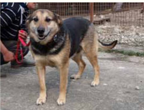
27) ELVIRA, weiblich, 9 Jahre alt, 55 cm groß, Crotal 26547, Auslauf 20/22

Duster wurde zwischen Weihnachten und Neujahr von einer älteren Dame über mehrere Tage auf dem Friedhof Pitestis gesehen. Weil es zu dieser Zeit eisig kalt und der Rüde der Kälte schutzlos ausgeliefert war, rief die Dame bei uns an. Unsere Mitarbeiter nahmen Duster zu uns in die Smeura und versorgten ihn. Mittlerweile ist Duster gechipt, geimpft und kastriert und auf der Suche nach einem liebevollen Zuhause.