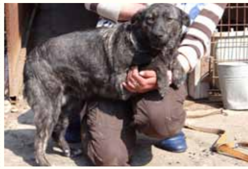
47) HADRIA, weiblich, 2 Jahre alt, 45 cm groß, Crotal 27876, Auslauf 21/21

Iulia wurde Zeit ihres Lebens auf einem Fabrikgelände von den dortigen Mitarbeitern versorgt. Dort konnte die ältere Hündin geschützt vor den städtischen Hundefängern leben. Leider musste die Firma schließen. Am letzten Arbeitstag rief ein älterer Herr an und bat uns, Iulia abzuholen, er habe sie knapp 5 Jahre versorgt und könne sie nicht in seine Stadtwohnung mitnehmen. Wir versicherten dem freundlichen Herrn, dass Iulia niemals den städtischen Hundefängern zum Opfer fallen werde und nahmen sie zu uns in die Smeura. Iulia zeigt sich verträglich, Menschen gegenüber ist sie etwas verhaltener, jedoch mit sehr freundlichem Charakter.