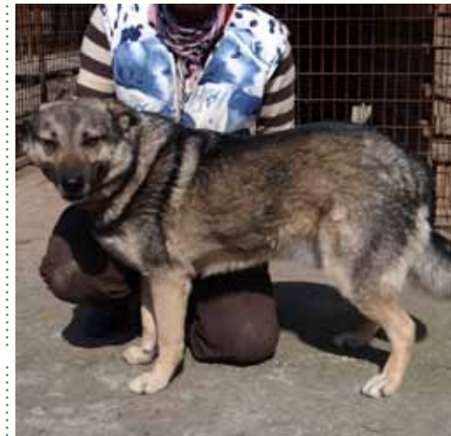
66) KARISA, männlich, 6 Jahre alt, 60 cm, Crotal 24062, Auslauf 21/20

Karla ist eine sehr soziale Hündin, die an anderen Hunden wenig Interesse zeigt. Die unruhige Situation in unserer Smeura belastet sie sehr. Für Karla wünschen wir uns ein liebevolles Zuhause.