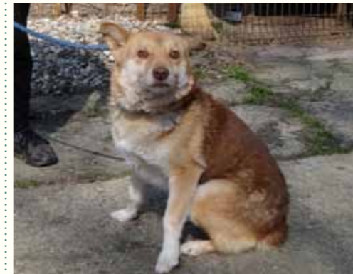
65) KASCH, männlich, 5 Jahre alt, 40 cm groß, Crotal A3567, Auslauf 19/16

Kalona wurde nachts vor unserer Smeura ausgesetzt. Unser Nachtwächter hatte beobachtet, wie sich ein Fahrzeug näherte und ebenso schnell wieder verschwand. Kalona versuchte noch einige Meter dem Auto hinterher zu rennen, konnte es jedoch nicht und legte sich nieder. Unser Nachtwächter nahm sie behutsam auf und brachte sie bis zum kommenden Morgen in die Krankenstation. Kalona ist eine freundliche Hündin gesetzteren Alters, die an anderen Hunden keinerlei Interesse hat. Menschen gegenüber zeigt sie sich aufgeschlossen und freundlich.