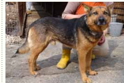
26) ENZO, männlich, 5 Jahre alt, 55 cm groß, Crotal 28103, Auslauf 21/22

Edda wurde in einem völlig verwahrlosten Zustand nachts im Wald vor unserer Smeura voller Flöhe, Zecken und einer offenen Wunde am hinteren rechten Bein ausgesetzt. Unser Nachtwächter entdeckte die Hündin und brachte sie rasch in die Krankenstation. Gemeinsam mit der diensthabenden Pflegerin der Krankenstation wurde Edda versorgt und am nächsten Morgen durch unseren Tierarzt behandelt. Glücklicherweise stabilisierte sich Edda rasch und konnte von der Krankenstation in eine Auslaufgruppe integriert werden. Edda zeigt sich aufgeschlossen und verträglich mit anderen Hunden. Für Edda wünschen wir uns ein liebevolles Zuhause.