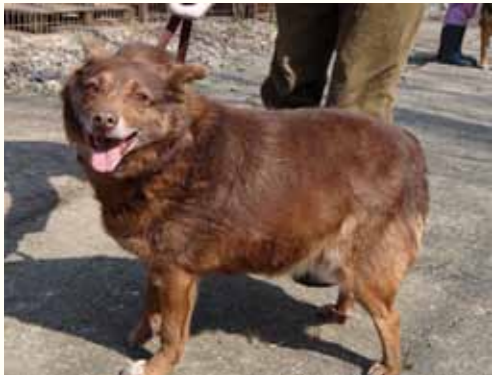
70) LAURELEI , weiblich, 4 Jahre alt, 40 cm, Crotal 24395, Auslauf 18/9

In der Smeura stellte unser Tierarzt fest, dass das Kettenhalsband in die Haut eingewachsen war und unter herausoperiert werden musste. Mittlerweile hat sich Maddalen erholt, ist bereits kastriert und auf der Suche nach einem liebevollen warmen Platz.