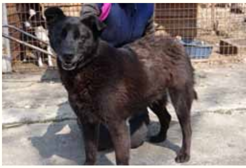
67) KRIMHILDE , weiblich, 4 Jahre alt, 55 cm, Crotal 18629, Auslauf 22/26

Krimhilde wurde am Bahnhof von Pitesti ausgesetzt aufgefunden. Ein Mitarbeiter der Bahn alarmierte uns und bat um rasche Übernahme aufgrund der hohen Gefahr des Schienenverkehrs. Wir eilten zum Bahnhof und nahmen Krimhilde zu uns. Krimhilde zeigt sich ausgesprochen freundlich und verträglich gegenüber anderen Hunden.