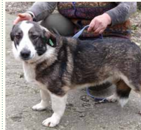
21) DORINA, weiblich, 4 Jahre alt, 40 cm, Crotal 24879, Auslauf 26/29

Mittlerweile sind Carmelas Welpen in Deutschland und auch Carmela ist auf der Suche nach einem liebevollen Zuhause für ihren letzten Lebensabschnitt!