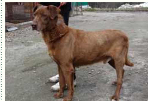
9) BALDWIN, männlich, 12 Jahre alt, 60 cm groß, Crotal 15870, Auslauf 26/30

Aretha wurde im Jahre 2010 durch uns kastriert und als freilebende Hündin wieder zurück auf die Straße gesetzt. Aufgrund der Gesetzeslage konnte Aretha trotz Absicherung durch eine eingerichtete Futterstelle nicht mehr auf der Straße leben. Glücklicherweise konnten wir den städtischen Hundefängern zuvorkommen und nahmen Aretha zu uns in unsere Smeura. Aretha zeigt sich fremden Menschen gegenüber eher verhaltener, taut jedoch nach kurzer Eingewöhnungsphase auf. Nun wünschen wir uns für die ältere Hündin ein liebevolles Zuhause.