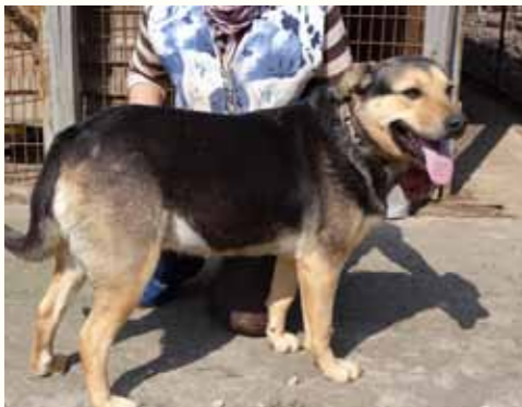
58) JUDITH, weiblich, 7 Jahre alt, 60 cm Crotal A6739, Auslauf 21/20