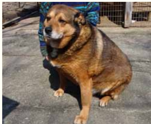
81) MINNE, männlich, 7 Jahre alt, 60 cm Crotal 24503, Auslauf 17/23

Merek wurde zur Kastration in unserer Smeura abgegeben und - wie sehr häufig- nicht mehr abgeholt. Der ältere Rüde zeigt sich ausgesprochen freundlich und kontaktsuchend, mit anderen Hunden zeigt er sich verträglich und eher desinteressiert.