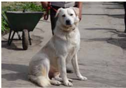
94) RABAN, männlich, 6 Jahre alt, 60 cm groß, Crotal 27351, Auslauf 20/4

Leider fiel der Rüde den städtischen Hundefängern des ehemaligen Bürgermeisters Tudor Pendiuc zum Opfer und musste 13 schreckliche Tage in der städtischen Tötungsstation ein trauriges Dasein fristen, bis wir den Rüden zu uns in die Smeura holen konnten. Raban ist ein freundlicher, temperamentvoller Rüde, der sich in seiner Gruppe mit seinen Artgenossen verträglich zeigt.