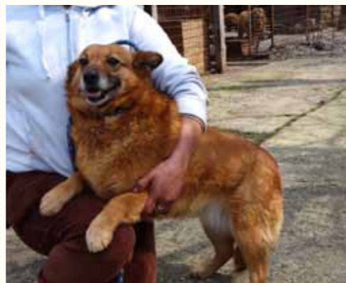
15) CLARA, weiblich, 7 Jahre alt, 40 cm groß, Crotal A7535, Auslauf 19/22

Bine wurde im April 2014 völlig verängstigt in der Stadt von unserem Notfallteam aufgefunden. Die Hündin wurde entweder von einem Auto angefahren oder wurde misshandelt, denn sie hatte etliche Prellungen und Hautverletzungen. Bei einer Röntgenkontrolle konnten keine Knochenbrüche festgestellt werden. Bine zeigt sich anderen Hunden gegenüber eher verhalten-er und ist den ihr bekannten Menschen sehr aufgeschlossen und kontaktsuchend.