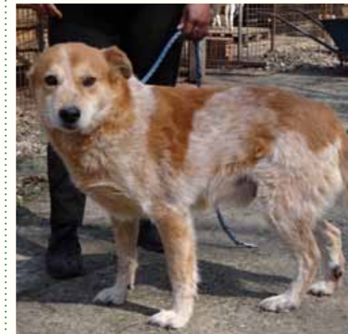
78) MANFRED , männlich, 10 Jahre alt, 55 cm, Crotal 16640, Auslauf 19/23

Ein Anwohner der Gegend hatte sich über sein Hundegebell beschwert und verständigte die städtischen Hundefänger. Leider gelang es ihnen, Martell vor uns zu fangen und der freundliche Rüde musste ein trauriges Dasein in der städtischen Tötungsstation fristen, bis wir ihn zu uns nahmen. Martell zeigt sich freundlich gegenüber Menschen und ist anderen Hunden gegenüber verträglich.