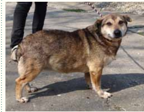
52) IZZI, weiblich, 14 Jahre alt, 35 cm groß, Crotal 19085, Auslauf 22/31

Jenny wurde 2005 bei uns in der Smeura kastriert und lebte seit dem als freilebende Hündin auf den Straßen Pitestis. Leider wurde sie durch die städtischen Hundefänger Ende 2013 eingefangen und sollte in der Tötungsstation umgebracht werden... Nach Ablauf der 14 Tagesfrist übernahmen wir Jenny zu uns in die Smeura. Die ältere Hündin zeigt sich ausgesprochen freundlich und mit anderen Hunden verträglich. Für Jenny wünschen wir uns ein liebevolles ruhiges Zuhause für ihren letzten Lebensabschnitt.