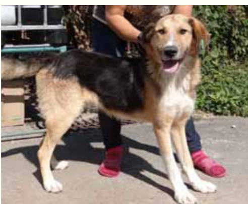
35) FIMEEA, weiblich, 8 Jahre alt, 35 cm groß, Crotal 19800, Auslauf 22/36

Felicia wurde vergangenen Winter von ihrem Besitzer aufgrund ihres Alters abgegeben. Felicia ist eine ruhige und sehr menschenbezogene Hündin, die innerhalb kürzester Zeit eine Beziehung zu ihrer Tierpflegerin aufgebaut hat. Felicia zeigt sich an anderen Hunden eher desinteressiert und verhaltener.