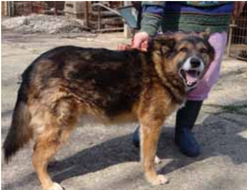
71) LARENZO , männlich, 9 Jahre alt, 60 cm, Crotal 24194, Auslauf 17/21

Laurelei wurde gemeinsam mit ihren fünf Welpen vor unserer Smeura im Wald gefunden. Vermutlich wurde sie hier in der Nacht ausgesetzt. Mittlerweile sind ihre Welpen in Deutschland. Laurelei hatte bislang noch keine Chance auf ein liebevolles Zuhause. Laurelei ist gechipt, geimpft und kastriert, mit anderen Hunden zeigt sie sich verträglich und aufgeschlossen.