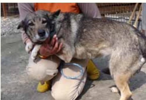
32) FELICIA, weiblich, 9 Jahre alt, 55 cm groß, Crotal 15982, Auslauf 21/22

Felicia wurde vergangenen Winter von ihrem Besitzer aufgrund ihres Alters abgegeben. Felicia ist eine ruhige und sehr menschenbezogene Hündin, die innerhalb kürzester Zeit eine Beziehung zu ihrer Tierpflegerin aufgebaut hat. Felicia zeigt sich an anderen Hunden eher desinteressiert und verhaltener.