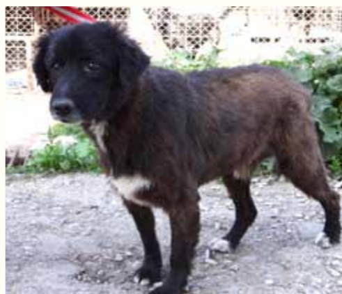
43) HORIA, männlich, 8 Jahre alt, 55 cm groß, Crotal 24431, Auslauf 19/15

Gorki wurde im Stadtzentrum von Pitesti aufgefunden. Glücklicherweise konnten wir den städtischen Hundefängern zuvorkommen. Gorki ist ein sehr verspielter, gut sozialisierter Rüde, der sich mit Artgenossen verträglich zeigt.