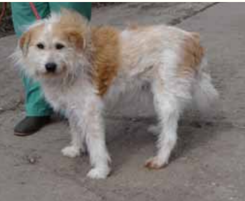
101) RICKI, männlich, 7 Jahre alt, 55 cm groß, Crotal 25016, Auslauf 4/7

Richenda ist eine freundliche und verträgliche Hündin, die sich anfangs etwas verhaltener zeigt.