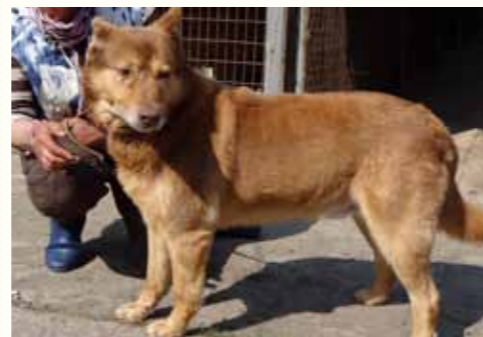
60) JARVIS, männlich, 5 Jahre alt, 60 cm, Crotal 17786, Auslauf 21/20

Jasmina wurde von einem tierlieben Kioskbesitzer vor den städtischen Hundefängern in Sicherheit gebracht. Der Kioskbesitzer griff beherzt zu, als er den Lieferwagen der städtischen Hundefänger sah und versteckte Jasmina in seinem Kiosk. Kurioserweise hielt das Fahrzeug vor dem Kiosk an und einer der Hundefänger kaufte bei ihm Zigaretten. Nachdem sie wieder weggefahren waren, rief der Mann sofort unsere Notfallnummer an und bat um schnelle Übernahme, da ihm doch ein wenig mulmig zumute war und er Angst um Jasmina hatte. Jasmina zeigt sich ausgesprochen freundlich und verträglich.