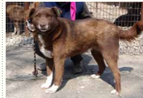
75) MACON , männlich, 7 Jahre alt, 55 cm groß, Crotal 24648, Auslauf 22/25

Macian wurde im Hof einer Kirche durch die städtischen Hundefänger brutal eingefangen und in die städtische Tötungsstation gebracht. Eine Kirchgängerin hatte die brutale Art und Weise des Einfangens beobachtet und eine Beschwerde ans Rathaus gesendet. Wohl blieb diese bis zum heutigen Tage unbeantwortet und ignoriert... Macian ist zwischenzeitlich gechipt, geimpft und kastriert und sucht ein liebevolles Zuhause mit ruhigem Umfeld. Macian frisst unter Stress oder Lärm über Tage nicht und wird deshalb von unserem Lagermeister gesondert im Lagerraum gefüttert.