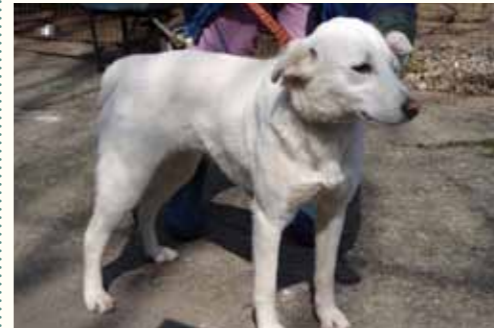
55) JANA, weiblich, 3 Jahre alt, 55 cm groß, Crotal 26649, Auslauf 17/14

Izzi lebte Zeit ihres Lebens auf dem Parkplatz eines Supermarktes in einem Nachbarort von Pitesti. Hier wurde sie von den dortigen Mitarbeitern versorgt. Izzi wurde leider Opfer der städtischen Hundefänger, die sie in die Tötungsstation des ehemaligen Bürgermeisters Tudor Pendiuc brachten. Nach Ablauf der 14 Tagesfrist übernahmen wir die ältere Hündin zu uns in die Smeura. Izzi wirkt oftmals sehr traurig und benötigt dringend einen liebevollen Platz für ihren letzten Lebensabschnitt.