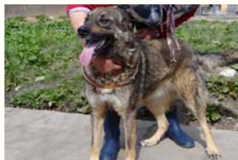
84) NICKLAUS, männlich, 5 Jahre alt, 65 cm groß, Crotal 24689, Auslauf 21/2

Nette wurde verunfallt auf den Straßen Pitestis durch unsere Mitarbeiter vom Notfallteam aufgefunden. Vermutlich durch einen Autounfall zog sie sich eine schwere Kopfverletzung zu, bei dem ihr linkes Auge so sehr in Mitleidenschaft gezogen wurde, dass wir es entfernen mussten. Nette kommt mit der Beeinträchtigung gut zurecht und ist eine freundliche und aufgeschlossene Hündin, die sich mit anderen Hunden sehr verträglich zeigt.