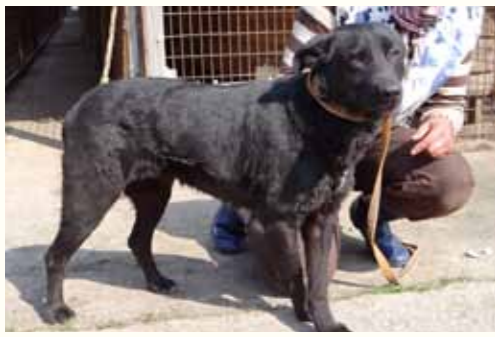
45) HANNA, weiblich, 2 Jahre alt, 55 cm groß, Crotal 27872, Auslauf 21/21