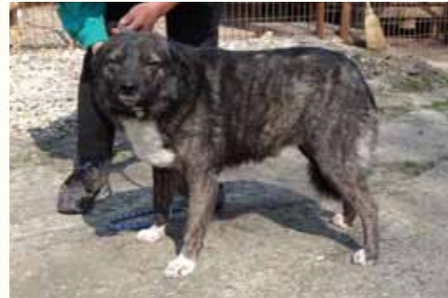
72) LENNARD , männlich, 6 Jahre alt, 50 cm, Crotal 28201, Auslauf 19/13

Lorenzo wurde nach Ablauf der 14-Tagesfrist aus der städtischen Tötungsstation des ehemaligen Bürgermeisters Tudor Pendiuc zu uns in die Smeura geholt. Der Rüde wurde im Jahre 2009 durch uns kastriert und abgesichert durch eine Futterstelle wieder freigelassen. Leider fiel er den städtischen Hundefängern zum Opfer und fristete ein trauriges Dasein in der städtischen Tötungsstation. Lorenzo ist ein freundlicher und aufgeschlossener Hund, der sich mit anderen Hunden verträglich zeigt.